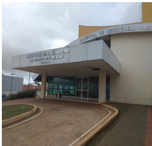
Fig. 01 – Entrada Internação