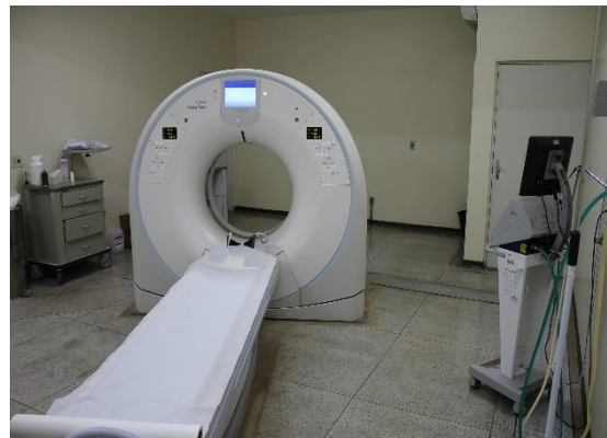
Fig. 08 – Sala de Tomografia