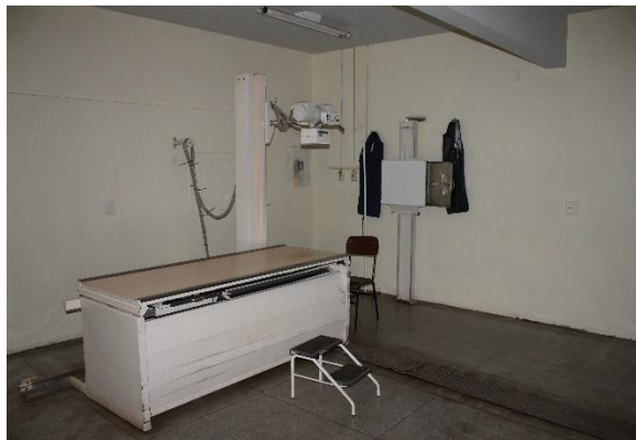
Fig. 07 – Sala de Raio X