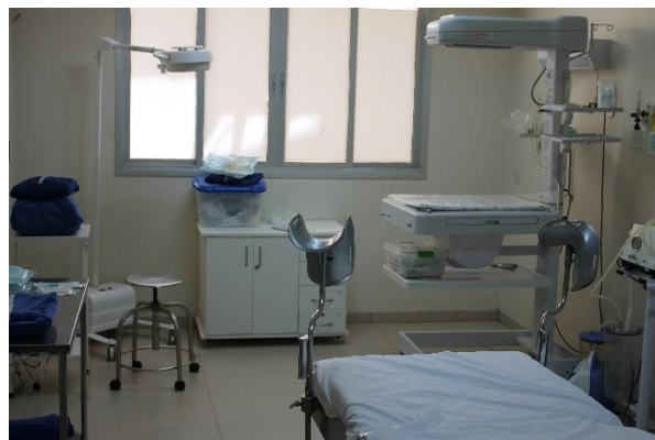
Fig. 06 – Ginecologia/Obstetrícia