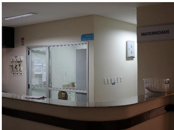
Fig. 05 – Maternidade