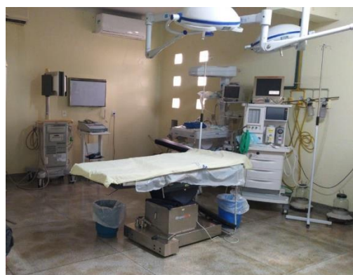
Fig. 10 – Bloco Cirúrgico

O HCSC dispõe de salas específicas para o funcionamento do Serviço de Apoio Diagnóstico e Terapêutico (SADT) – imagens abaixo , disponibilizando serviços de Imagenologia e Laboratorial (exemplo: radiologia, ultrassonografia, tomografia computadorizada, eletrocardiograma, anatomia patológica e análises clínicas) aos usuários atendidos em regime de urgência/emergência, internação e egressos.