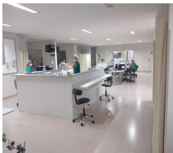
Fig. 04 - UTI