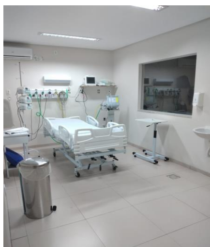
Fig. 03 - Leito UTI