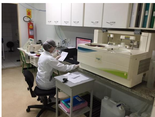
Fig. 09 – Laboratório (provisório)