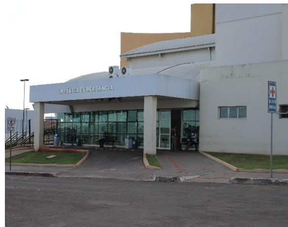
Fig. 02 – Entrada Emergência